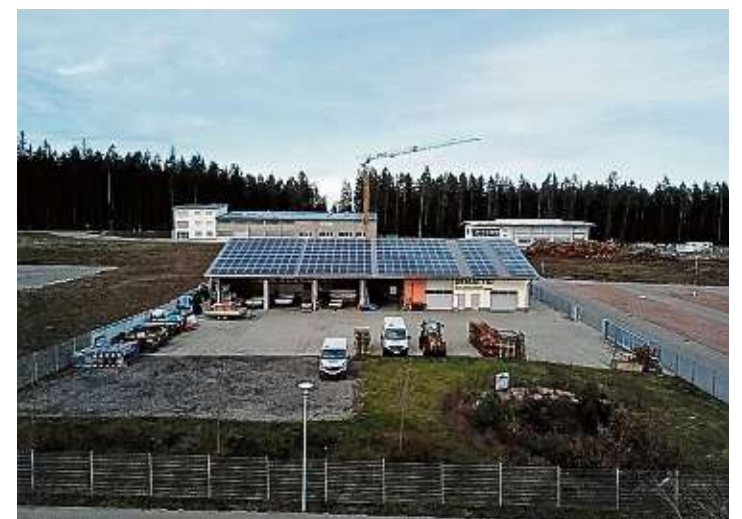
Der Blick mit der Drohne zeigt das großzügige Areal des Firmenbauhofs des Eisenbacher Bauunternehmens Demattio.

Wir gratulieren zu 125 Jahren Qualität und Kompetenz.