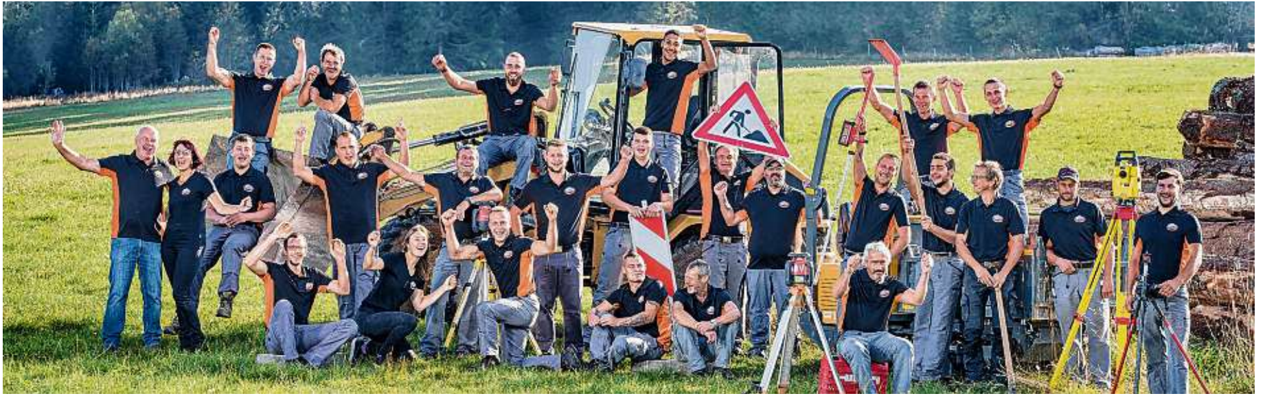
Hier macht die Arbeit Spaß: Das Eisenbacher Bauunternehmen Demattio besteht seit 125 Jahren, kann das Jubiläum aber nicht wie geplant feiern.