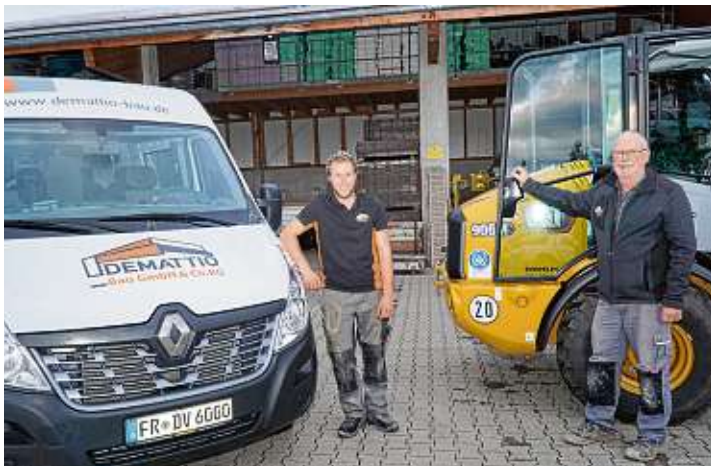
Seit 1895 geht das Baugeschäft Demattio auf den Sohn über: Irgendwann auch von Volker Demattio auf Sion Demattio.