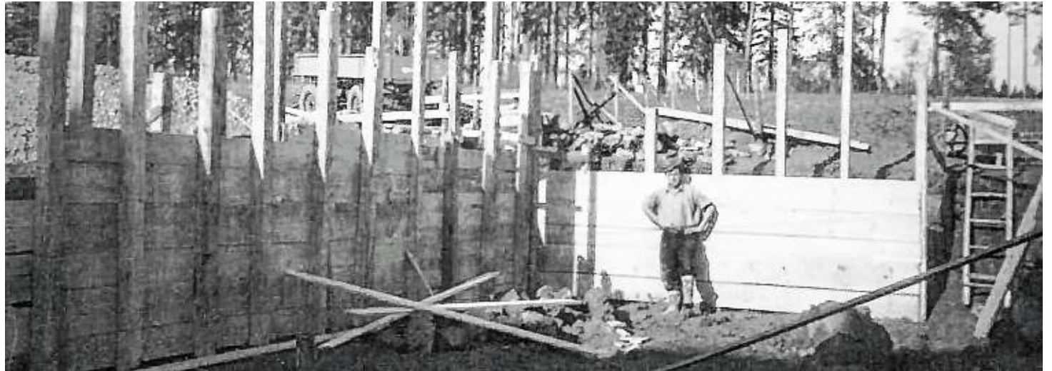
Fast alle Gebäude in Eisenbach tragen die Handschrift der Baufirma Demattio. Hier entsteht das Wasserreservoir in Oberbränd.